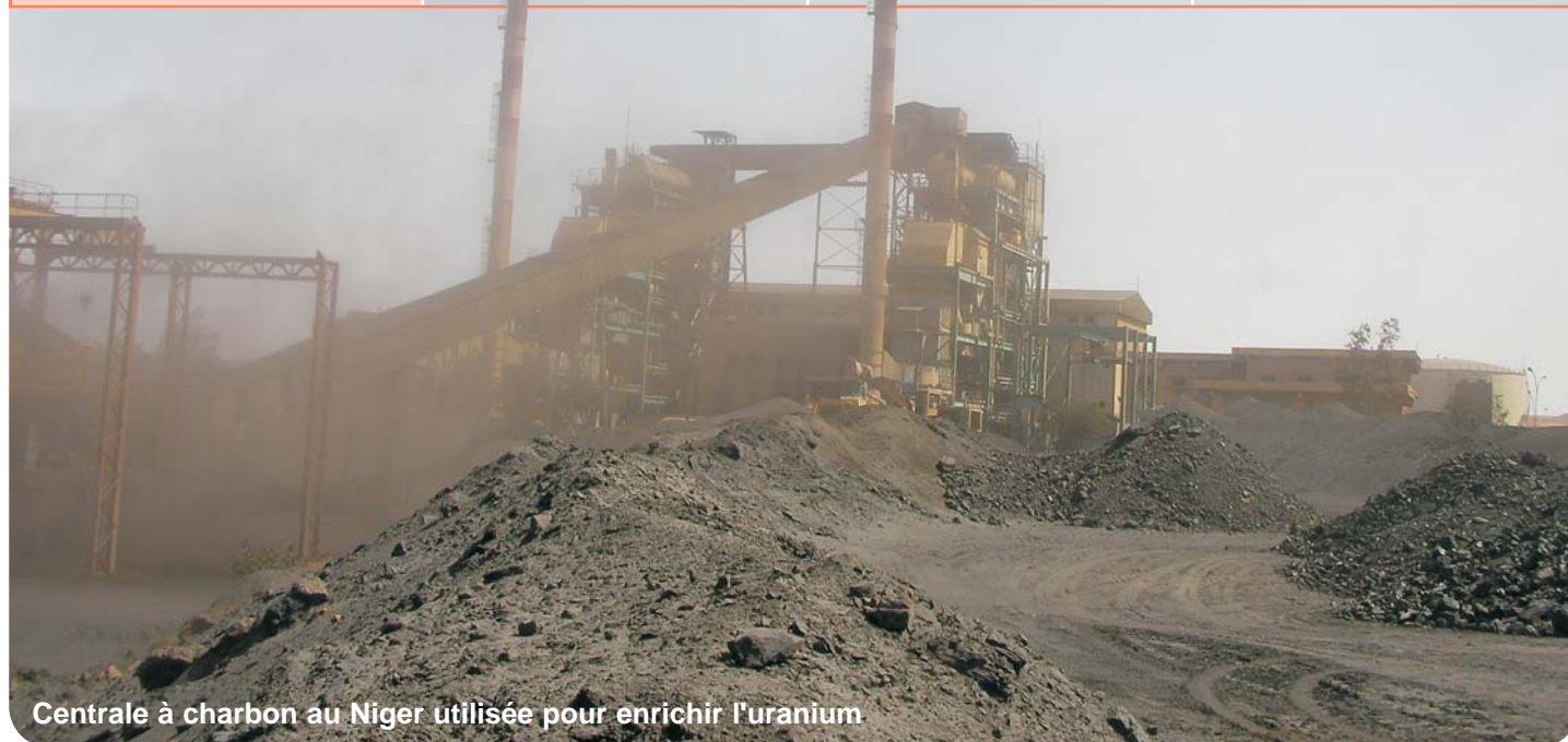
Centrale à charbon au Niger utilisée pour enrichir l'uranium